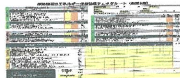
▲省エネチェックシート