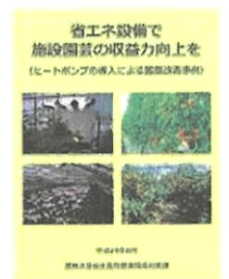
▲省エネで収益力向上を