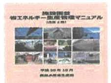
▲省エネマニュアル