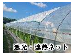
遮光・遮熱ネット